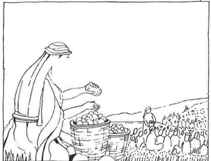
En Hij zegende het brood en brak het ...